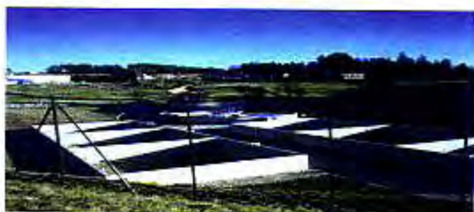
A Montfaucon : une nouvelle station d'épuration des eaux usées (après Raucoules et St Jeures)