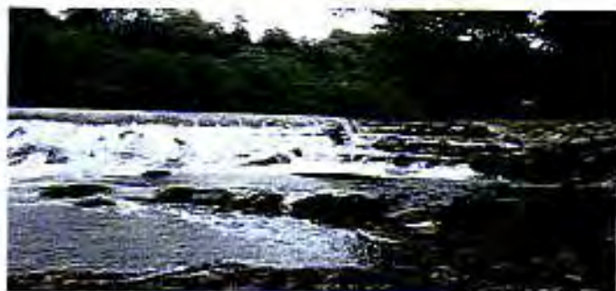
Levée des Frères : création d'une passe à poissons et d'une grille de désenvasement.

ON EN PARLAIT.....C'EST FAIT..... ET BIEN FAIT