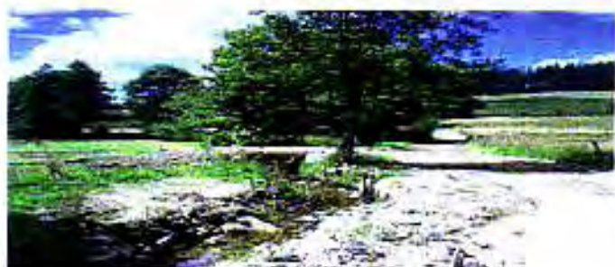
A La Naute, Le Trifoulou coulait dans un chemin : des travaux l'ont réinstallé dans son lit.