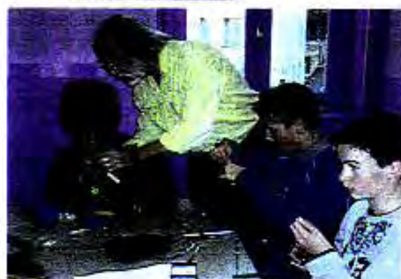
Apprentissage en salle